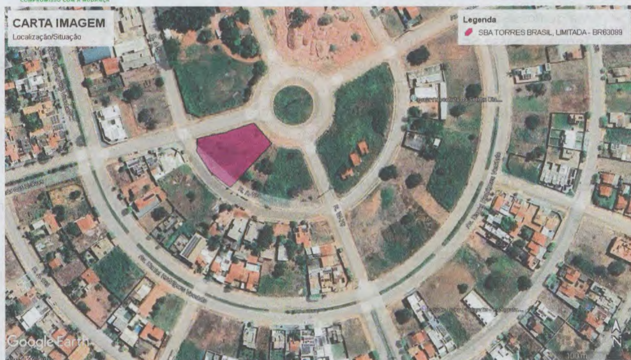
Figura 01. Localização da ERB – BR63089.